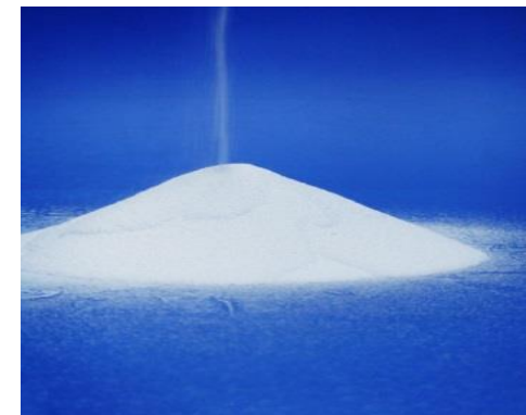
フッ素樹脂パウダーコーティング材