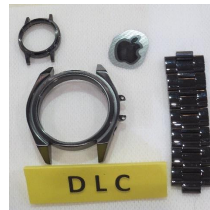
常温DLCコーティング